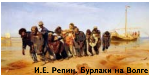
И.Е. Репин. Бурлаки на Волге

Чтобы присвоить чужой труд, надо приобрести в частную собственность завод, магазин, транспорт, типографию; в общем — средство для производства, и нанять рабочих. Возможность такого цивилизованного грабежа (присвоение плодов чужого труда) должна быть узаконена, и тогда грабеж, как бы, уже не кажется грабежом. Такая усовершенствованная эксплуататорская система и называется капиталистической.